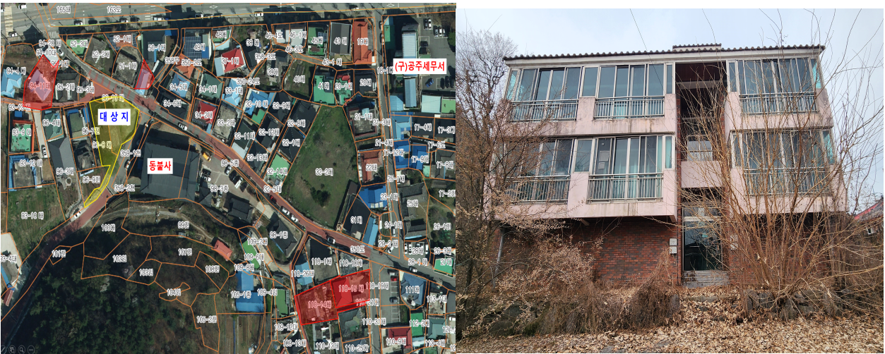
<위치도 및 조감도>